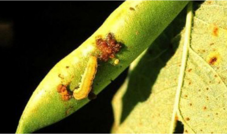
गवारो रोग

गवारो रोग लागीसकेपछि कोशामा प्वालहरू देखिन्छन् । लाभ्रले आधा शरीर कोशा भित्र पसाएर खाएको प्रष्ट देख्न सकिन्छ ।