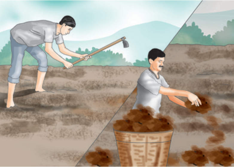
कृषकले जमिन तयार गरी मल राख्दै, चित्र: ग्रोइनोभा

जमिन तयारी गर्दा बाली लगाउने समयमा ४-५ पटक राम्रोसँग खनजोत गरी माटो बुरबुराउँदो बनाउनुपर्दछ र जमिनको अन्तिम तयारीमा २५ देखि ३० डोका प्रति रोपनीका दरले राम्रो कुहिएको गोबर मल माटोमा मिलाउनु पर्छ साथै पानी नजम्ने गरी जमिन सम्माउनुपर्दछ ।