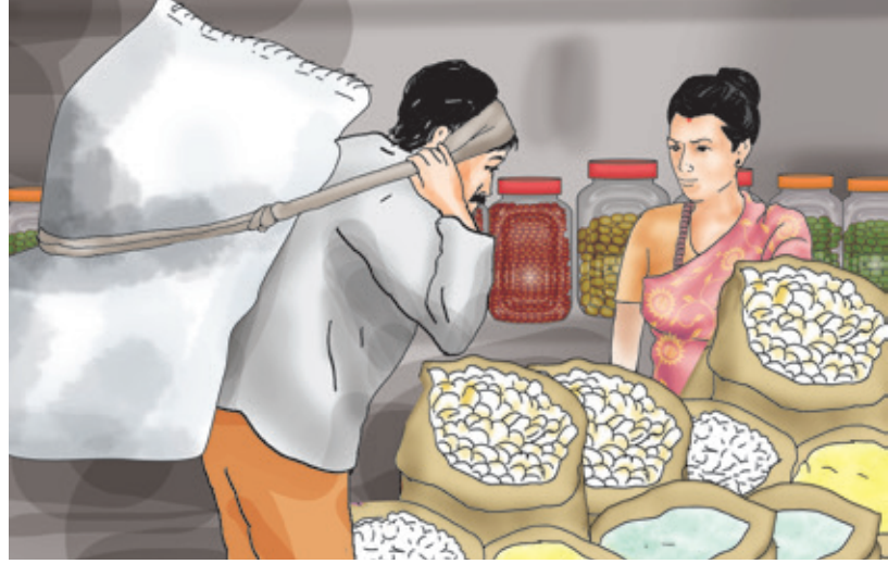
कृषकले बजारमा लगेर राजमा बेच्दै, चित्र: ग्रीडिनोभा

उत्पादन तथा खपतको दृष्टिकोणले राजमा महत्त्वपूर्ण बाली हो । उत्पादित राजमा स्थानीय स्तरमा सङ्कलन केन्द्र वा बजारमा पुऱ्याएर आफैँले वा थोक वा खुद्रा व्यापारी मार्फत बिक्रि गर्न सकिन्छ । समुहमा मिलेर कृषि सहकारी संस्थाहरू मार्फत सङ्कलन गरेर बजारसम्म पुऱ्याउँदा राम्रो मूल्य पाउन सकिन्छ भने ढुवानी खर्च र नोकसानी घटाउन सकिन्छ ।