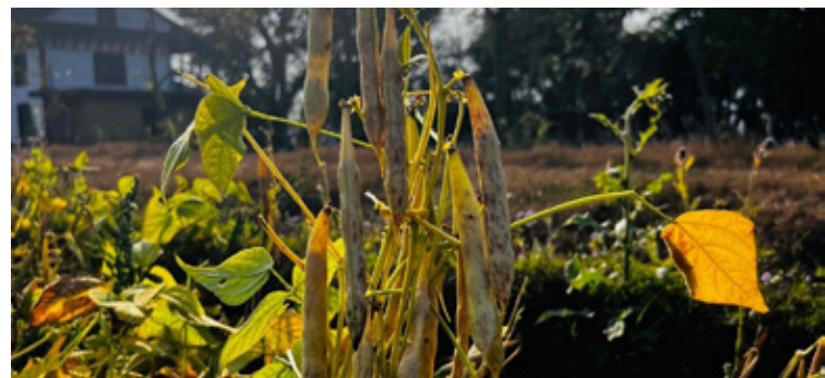
बाली लिन तयारी अवस्थामा, तस्विर : ऋषि राज वली, ली-बर्ड

राजमाको सरदर उत्पादन ८० देखि १०० के.जी प्रति रोपनी हुन्छ ।