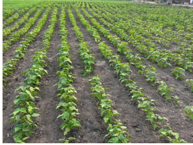
लाइनमा रोपिएको राजमा, तस्विर : ऋषि राज वली, ली-बर्ड