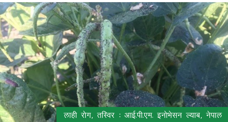
लाही रोग, तस्विर : आई.पी.एम. इनोभेसन ल्याब, नेपाल

लाही किराहरू हरिया, फुस्रा र खरानी रङ्गका हुन्छन् । यसले कलिला र फूल फुल्ने भाग खान बढी रुचाउँछन् ।