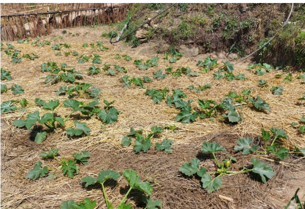
जैविक छापोको प्रयोग

यस प्रविधिमा जमिनको सतहलाई प्लास्टिकले अथवा बाली काटीसकेपछि बाँकी रहेका अवशेषले पूरै ढाकेर जैविक छापो (Bio-mulching) को रूपमा राखिन्छ, जसले गर्दा माटोको बनावट नबिग्रिने, माटोमा चिस्यान जोगाउने, सूक्ष्मजीवहरूको गतिविधिहरू बढ्ने र मलिलो सतही माटोको क्षय पनि ११-६४% कम हुने गर्दछ। विशेषतः अहिले तरकारी खेतीमा मध्यम तथा ठुला कृषकहरूले सीमित रूपमा प्लास्टिकलाई छापोको रूपमा प्रयोग गरिरहेका छन्। सुरुवाती चरणमा लागत केही बढी भएतापनि पानीको बचत, झारपात व्यवस्थापनमा टेवा पुऱ्याउने हुनाले यसको अपनाउने दर बढ्दो क्रममा रहेको छ। प्लास्टिक छापोको तुलनामा जैविक छापो संरक्षण कृषिका लागि बढी उपयोगी हुन्छ।