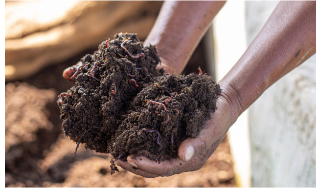
जैविक मलको प्रयोग

जैविक मल भन्नाले स्थानीय स्तरमा पाइने जैविक पदार्थहरू जस्तै, बोटविरुवा र तिनका पातपतिङ्गर, झारपात, मलमुत्र, भान्छाको फोहोर, आदिबाट तयार पारिएको मललाई जनाउँदछ। यसरी तयार पारिएको मलले बोटविरुवालाई आवश्यक पोषक तत्वहरू प्रदान गर्दछ र माटोको संरचना सुधार गर्दै माटोको उर्वराशक्ति पनि बढाउँदछ। यो कृषक आफैँले बनाउन सक्ने र अपनाउन सक्ने सजिलो र प्रभावकारी अभ्यास हो। जैविक मलको प्रयोगले माटोमा प्राङ्गारिक पदार्थ र कार्बनको मात्रा वृद्धि गर्न, रासायनिक मलको प्रयोग कम गर्न, माटोलाई ओसिलो र खुकुलो बनाउँदै दीर्घकालीन रूपमा स्वस्थ र उत्पादन वृद्धि गर्नमा महत्वपूर्ण भूमिका खेल्दछ। जैविक मलका प्रकारहरू विभिन्न छन् जसमा गोठे मल, कम्पोष्ट मल, गड्यौला मल, हरियो मल, झोल मल, इत्यादि पर्दछन्।