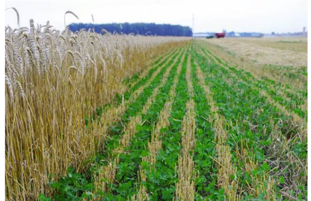
छापो बाली खेती

छापो बाली भन्नाले जमिनको सतहको माटो बग्न नदिने, पानीको व्यवस्थापन गर्ने, झारपातको न्यूनीकरण गर्ने, रोगकीराको न्यूनीकरण गर्ने र माटोको गुणस्तर बढाउने खालका बालीहरूलाई जनाउँदछ। खेतबारीको आवश्यकता अनुसार विभिन्न प्रकारका बालीहरू लगाउनुपर्दछ। यस्ता बालीहरू मुख्य बाली लगाउने बीचको समयमा जमिन खाली नराखी माटोलाई ढाक्ने गरी लगाइन्छन्। छापो बालीको रूपमा कोसेबाली वर्गमा पर्ने क्लोभर (clover), भेच (vetch), केराउ आदि; घाँस वर्गमा पर्ने राई, जौ, जै आदि प्रयोग गर्न सकिन्छ।