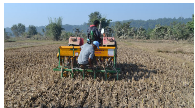
न्यूनतम खनजोत/ शून्य खनजोत प्रविधि

साथसाथै भू-क्षय हुनबाट पनि जोगाउँदछ। जस्तै खेतमा धान काट्ने समयमा केराउ, मसुरो वा अन्य दलहन बालीहरू छर्ने, धान काटेर बाँकी रहेका धानको गाँजको तुटोमा लसुनको केस्रा रोप्ने, आदि।