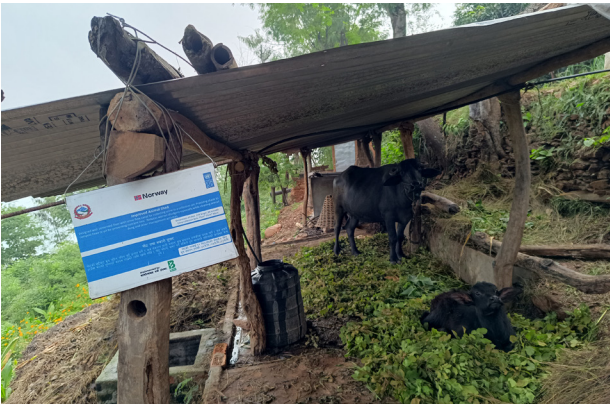
गोठ तथा भकारो सुधार

गोठ तथा भकारो सुधार भन्नाले गाईवस्तुलाई घाम, पानी र चिसोबाट जोगाउने छानो राखेर र मुत्रलाई खेर जान नदिइ खाडलमा जम्मा गरी व्यवस्थित पारिएको गोठ भन्ने बुझिन्छ। यसले पशुहरूको स्वास्थ्य, सरसफाइमा, उत्पादन क्षमता र व्यवस्थापनमा सुधार ल्याउनुका साथै गोठेमलको गुणस्तर वृद्धि गरी बालीहरूको उत्पादकत्व वृद्धिमा पनि महत्वपूर्ण भूमिका निर्वाह गर्दछ। मल तथा मुत्रमा हुने पोषक तत्वलाई नाश हुनबाट जोगाउन र माटोसम्म पुऱ्याउनका लागि गोठ तथा भकारो सुधार एकदमै आवश्यक हुन्छ।