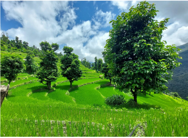
कृषि वन प्रणालीको अवलम्बन

कृषि वन प्रणाली भन्नाले जमिनमा रुख, झाडी, बाली र पशुपालनको संयोजन गरिने खेती प्रणालीलाई जनाउँदछ। यसमा रुखको लाइनहरूको बीचमा बाली लगाउने, रुख, घाँस, र पशुपालनलाई सँगै राख्ने, वा खेतबारीको छेउछाउमा बहुप्रयोजनका रुखहरू रोपेर हावाको प्रभाव कम गर्ने अभ्यासहरू समावेश हुन्छन्। यस अभ्यासले विशेष गरी पानीको संरक्षण गरी माटोको क्षयमा कमी र माटोको स्वास्थ्यमा सुधार ल्याउनुका साथै जलवायु परिवर्तनका असरहरूलाई कम गरी जैविक विविधताको संरक्षण र कृषकको आयस्तरमा वृद्धि गर्न सहयोग पुऱ्याउँदछ।